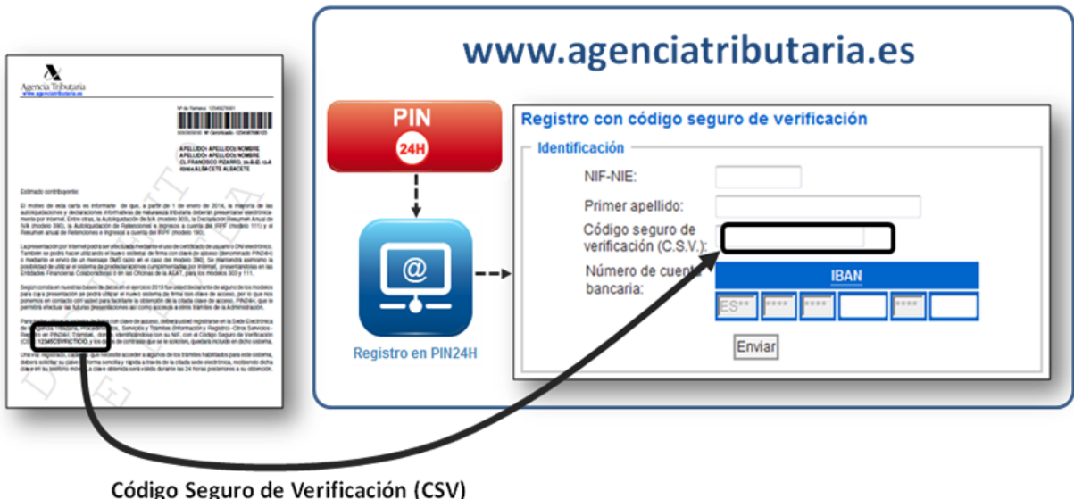
Código Seguro de Verificación (CSV)